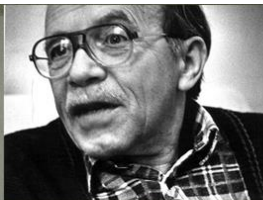
Михаил Яковлевич Гефтер

Это – зов людей к взаимной близости, недоступной без запрета на убийство.