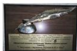
Работы учащихся напечатаны в сборнике сочинений «Война глазами детей»

Живая память. Живая, потому что память о погибших свято хранят их товарищи по оружию, их семьи и близкие. И память эта будет жива, пока мы об этом помним, пока мы говорим о тех событиях.