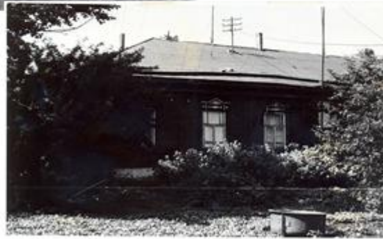
Бывший дом графа Н.А.Толстого Фото 1988 г.