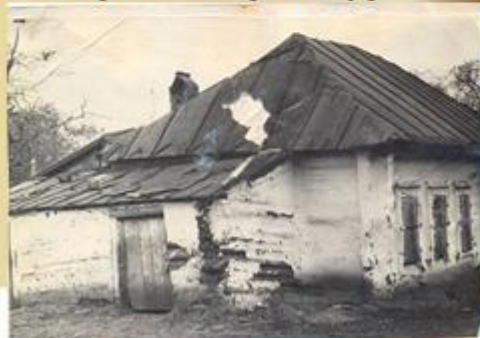
Фото 1946 года

Великая Отечественная война намного задержала развитие совхоза, а по производству зерна, мяса и молока отбросила его назад. Но и в эти годы в труднейших условиях военного времени, когда в совхозе работали почти одни женщины и подростки, совхоз выполнял задание государства по производству продукции. Александровцы, как и все советские люди, уходили на фронт добровольно и по призыву военкомата. 122 человека уже никогда не вернулись домой. Многие односельчане за участие в ВОВ были награждены правительственными наградами. И за каждый наградой стоит подвиг простых советских людей.