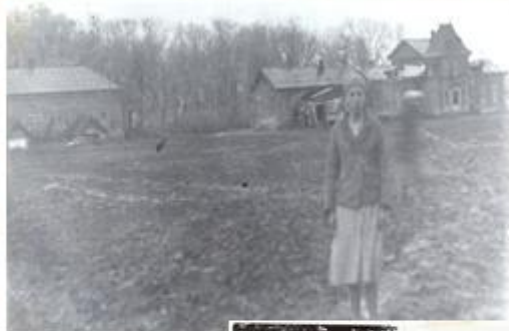
Бывшая усадьба графов Толстых в Александровке ( Справа 2-этажный графский дом, левее - кухня, маслозавод) Фото 1935 г.