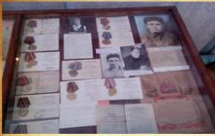
Героически сражались на фронтах Великой Отечественной войны- учителя школы