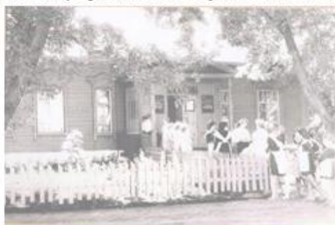
Фото 1989 года

И, конечно же, гордостью и «жемчужиной» нашего села является музей.