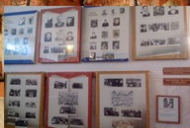
Зал истории школы