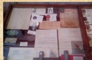
Зал боевой славы