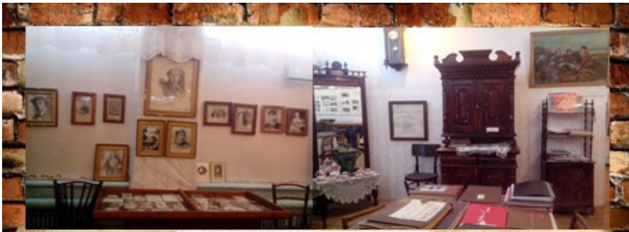
Зал истории села