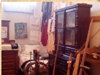
Предметы быта и орудия труда